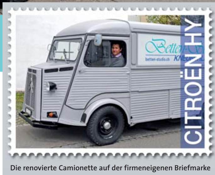
Die renovierte Camionette auf der firmeneigenen Briefmarke

Während vier Wochen wurden das Chassis, die Aufhängung und der Aufbau gründlich überholt, die Auspuffanlage sowie korrodierte Blech- und Aluminiumteile ersetzt und die Sitze neu gepolstert. Den Abschluss der Renovierung bildete eine komplette Neulackierung.