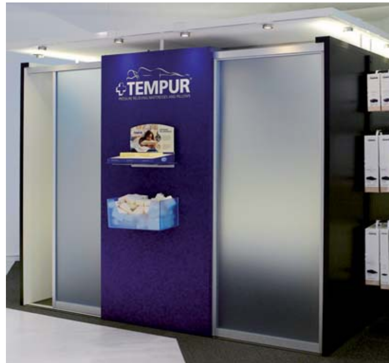
Lädt zum Ausprobieren ein: Das «TEMPUR®-Experience Center» im Betten-Studio Kneubühler.

Aber überzeugen Sie sich doch selbst. Kommen Sie einfach in unser Geschäft und probieren Sie aus, was am besten für Sie passt. Und lernen Sie das entspannende TEMPUR®-Gefühl beim Probeliegen in unserem TEMPUR®-Experience Center kennen.